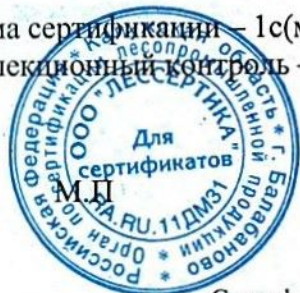
Схема сертификации – 1с(м). Инспекционный контроль – март 2027г., март 2028г.